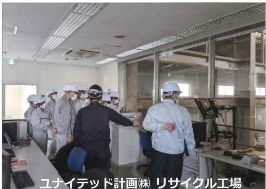
ユナイテッド計画(株) リサイクル工場

あきたスカイドーム幕屋根更新工事では、東京ドームと同じ素材の幕を使用しており、膜構造では日本で初めての改修工事であるという説明に生徒の皆さんも驚いていました。