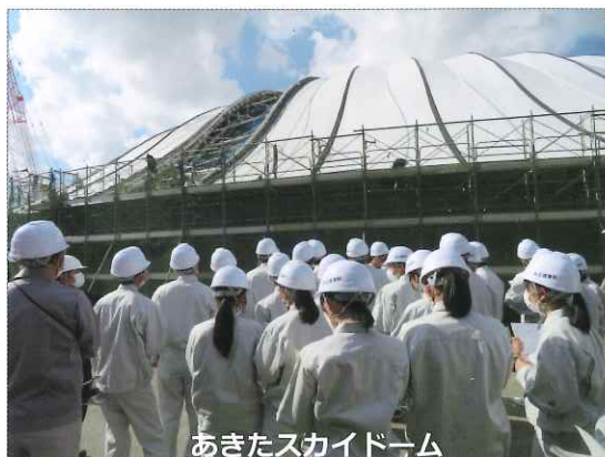
あきたスカイドーム