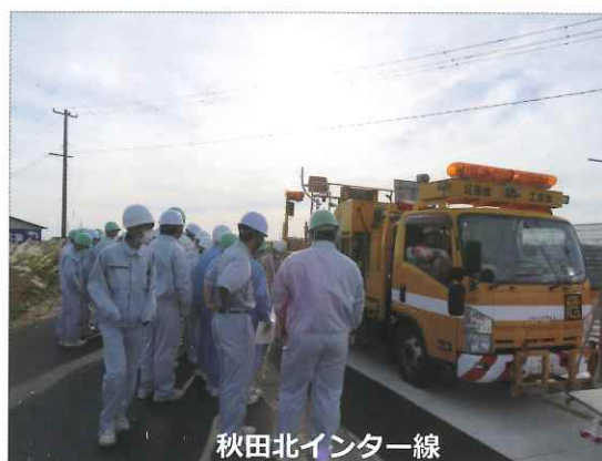
秋田北インター線

生徒の皆さんからは、「ICT技術を活用し作業の効率化を図っていて驚いた」「ほ場整備を行うことで農作物の収穫量や農作業の効率上がるのがわかった」「コンクリート舗装とアスファルト舗装の違いがわかった」などの感想がありました。