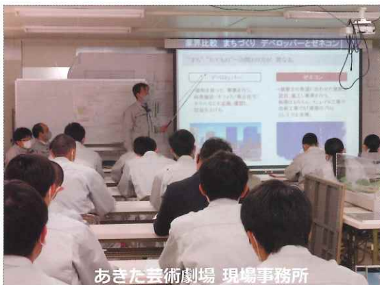
あきた芸術劇場 現場事務所

を説明してもらいました。仕上げ工事では、内装に県産材や秋田県伝統工芸を取り入れたり様々な工夫がされているという説明がありました。